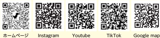
ホームページ Instagram Youtube TikTok Google map